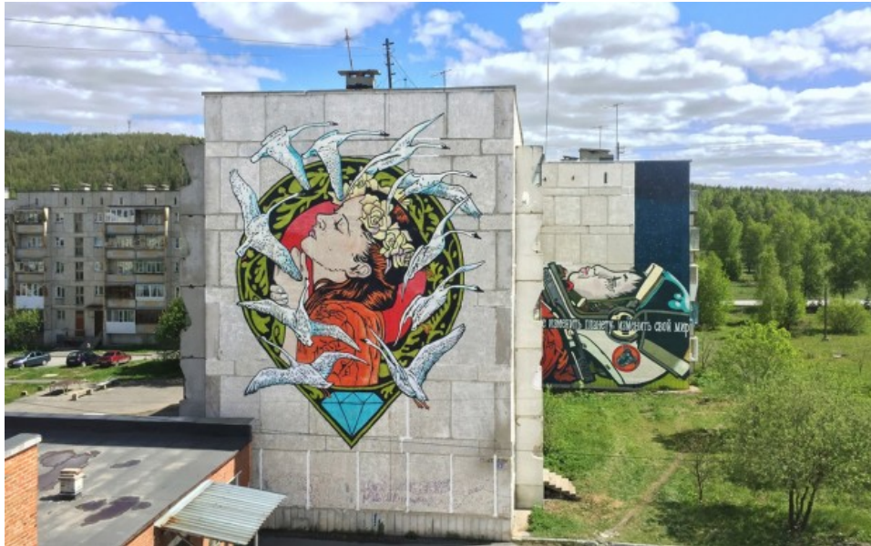
Diamond e Solo Satka Festival di Street art

Incontro con gli artisti Diamond e Solo sul tema "Citazione e contaminazioni": Street Art e Arte pubblica" Art Nouveau e fumetto.